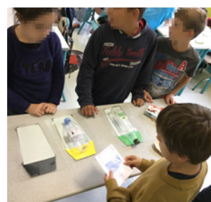
Réflexion / manipulation