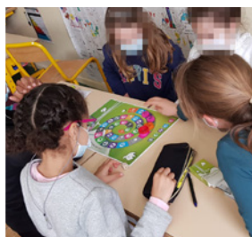
Jeu de l'oie